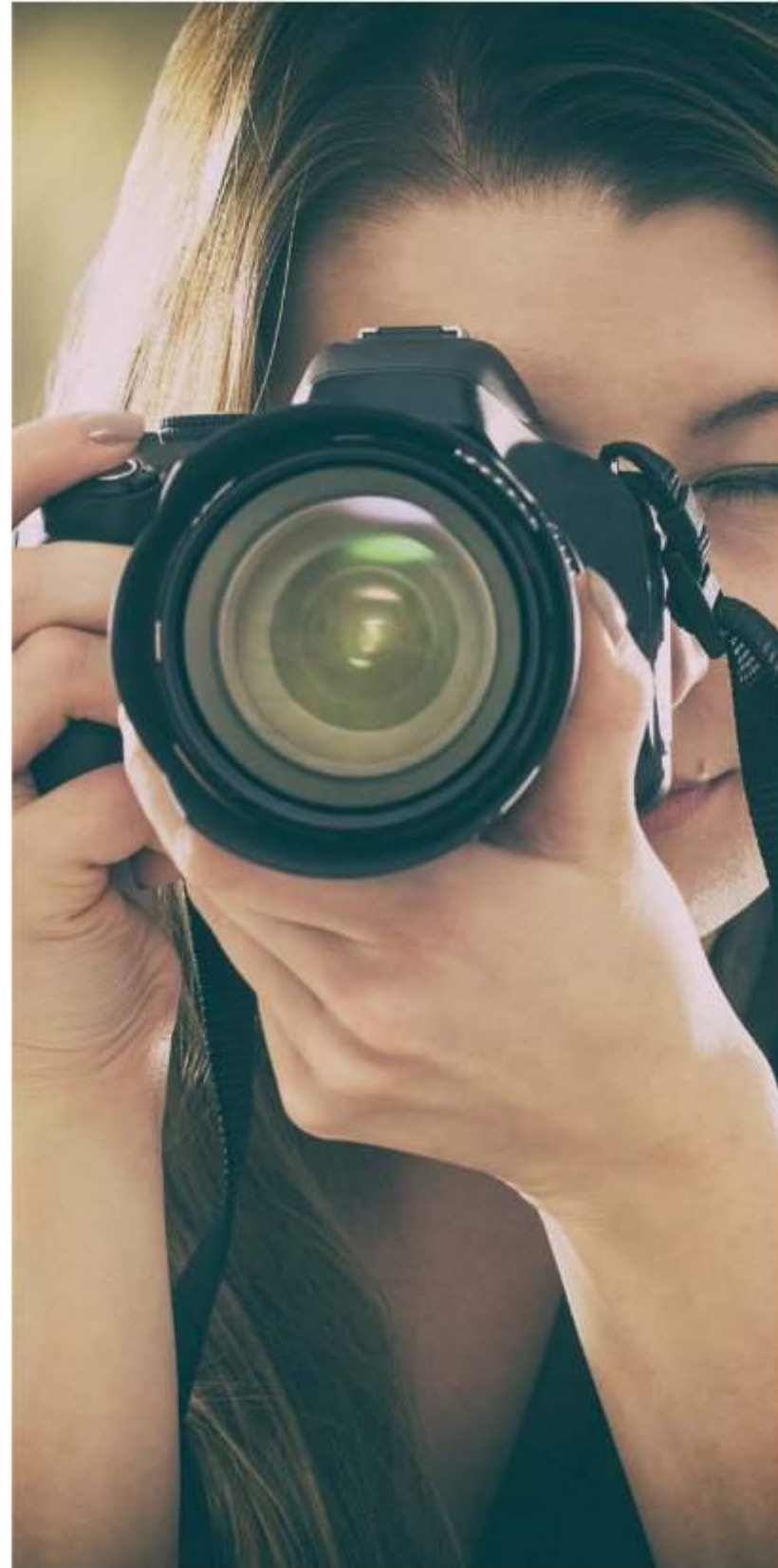
Creating Experiences تجربة لا تنسى

يربطكم السوق بالعديد من المرافق الترفيهية والخدمات التي تلبي احتياجاتكم المتنوعة، من المحال التجارية إلى سلسلة واسعة من المطاعم، مروراً بمسجد وحضانة، تحيطها الحدائق والمساحات الخضراء.