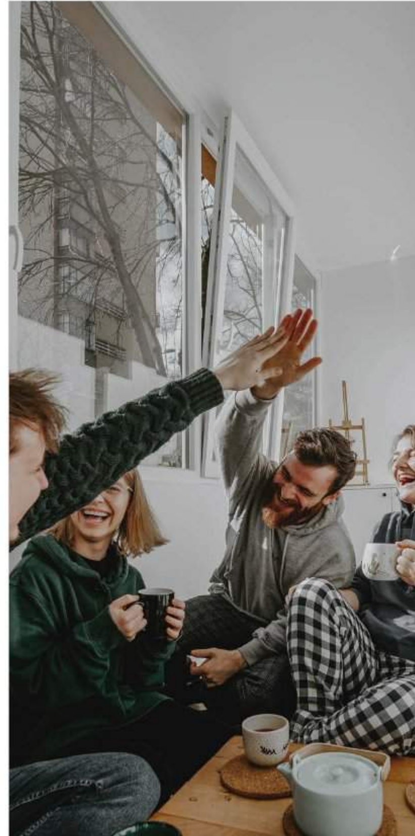
Promoting Community مجتمع واحد