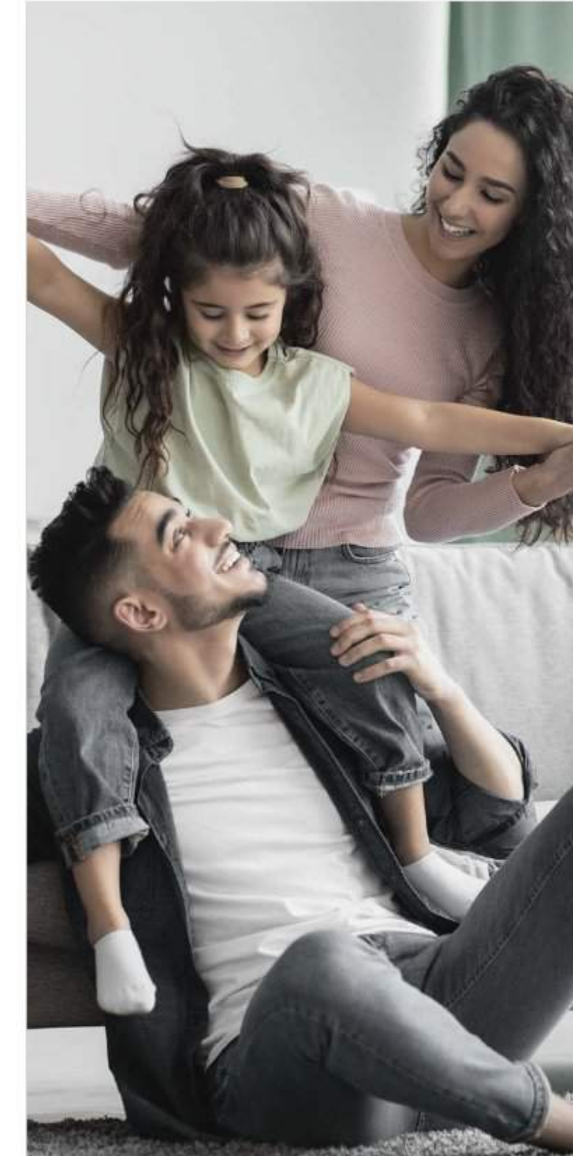
Celebrating Family الاحتفاء بالعائلة