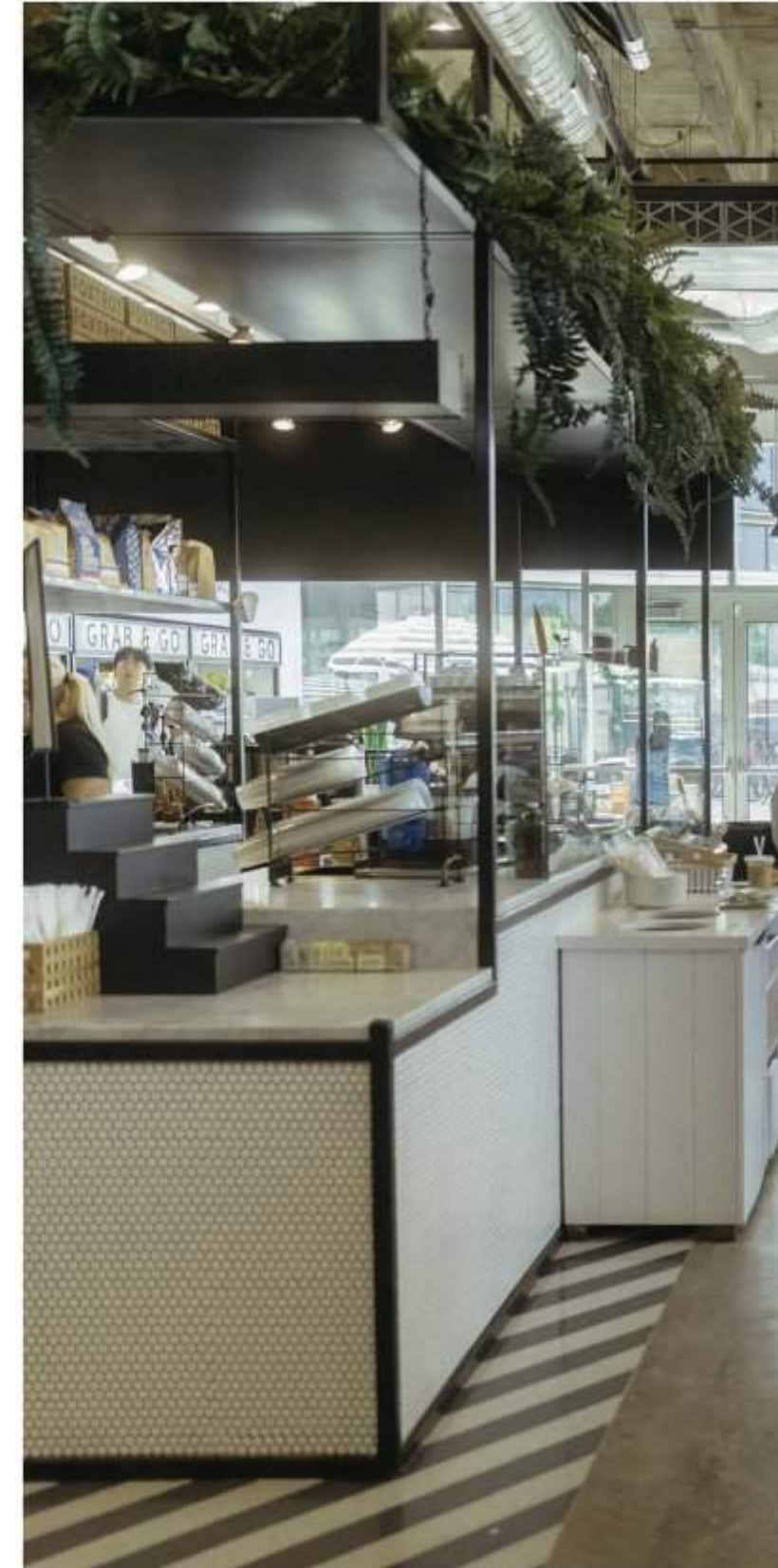
Offering Boutique Retail Experience محلات تجارية