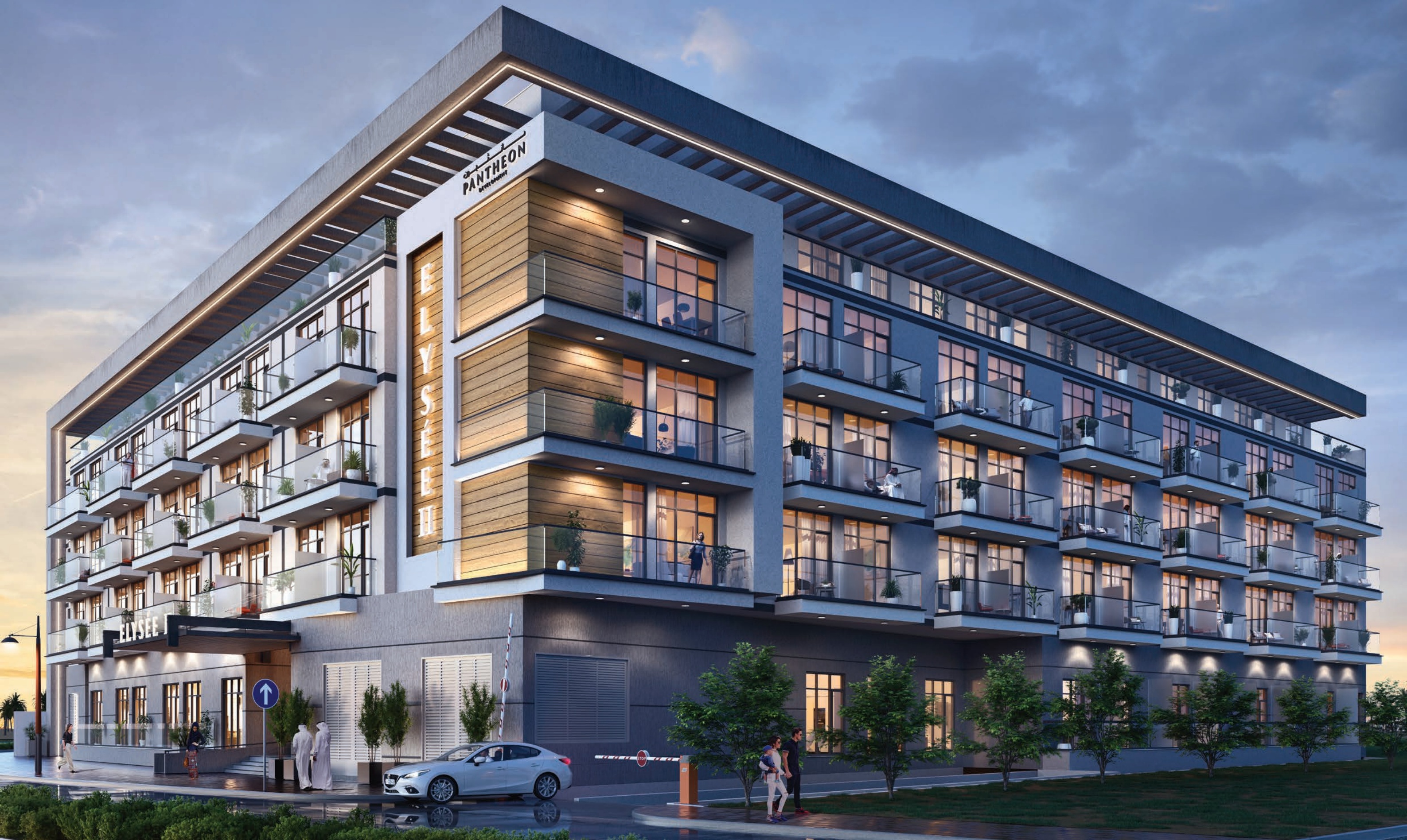
Pantheon Elysée III Location: District 13 (JVC)