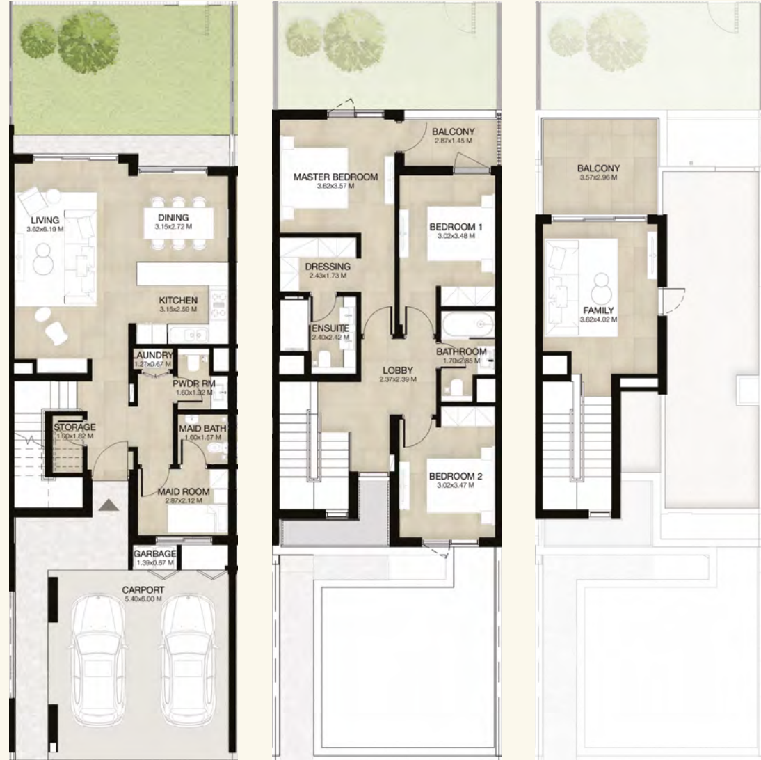
GROUND LEVEL الطابق الأرضي FIRST LEVEL الطابق الأول ROOF LEVEL السطح

3 غرف نوم + غرفة عائلية و غرفة خادمة - الوحدة المتوسطة