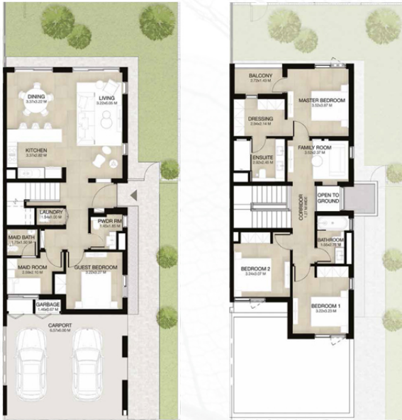
GROUND LEVEL الطابق الأرضي FIRST LEVEL الطابق الأول

4 غرف نوم + غرفة خادمة - الوحدة النهائية (مكسوة) المساحة الكلية: 236.78 متر مربع / 2,549 قدم مربع 4-BEDROOM+MAID - END UNIT (MIRRORED) TOTAL AREA: 236.78 SQM / 2,549 SQFT