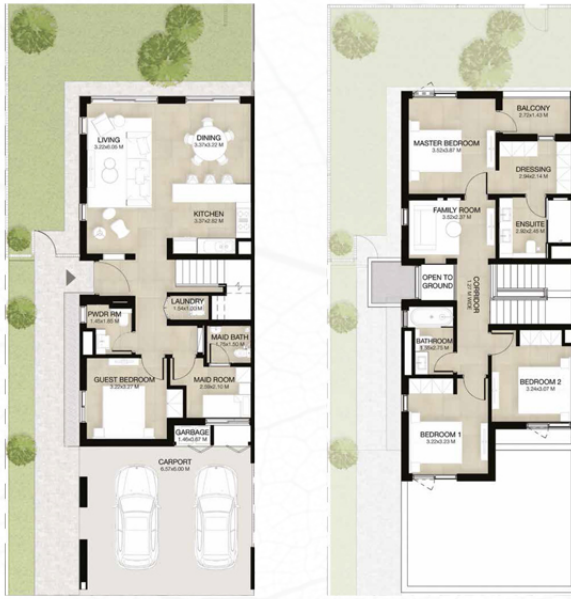
GROUND LEVEL الطابق الأرضي FIRST LEVEL الطابق الأول

4 غرف نوم + غرفة خادمة - الوحدة النهائية المساحة الكلية: 236.78 متر مربع / 2,549 قدم مربع 4-BEDROOM+MAID - END UNIT TOTAL AREA: 236.78 SQM / 2,549 SQFT