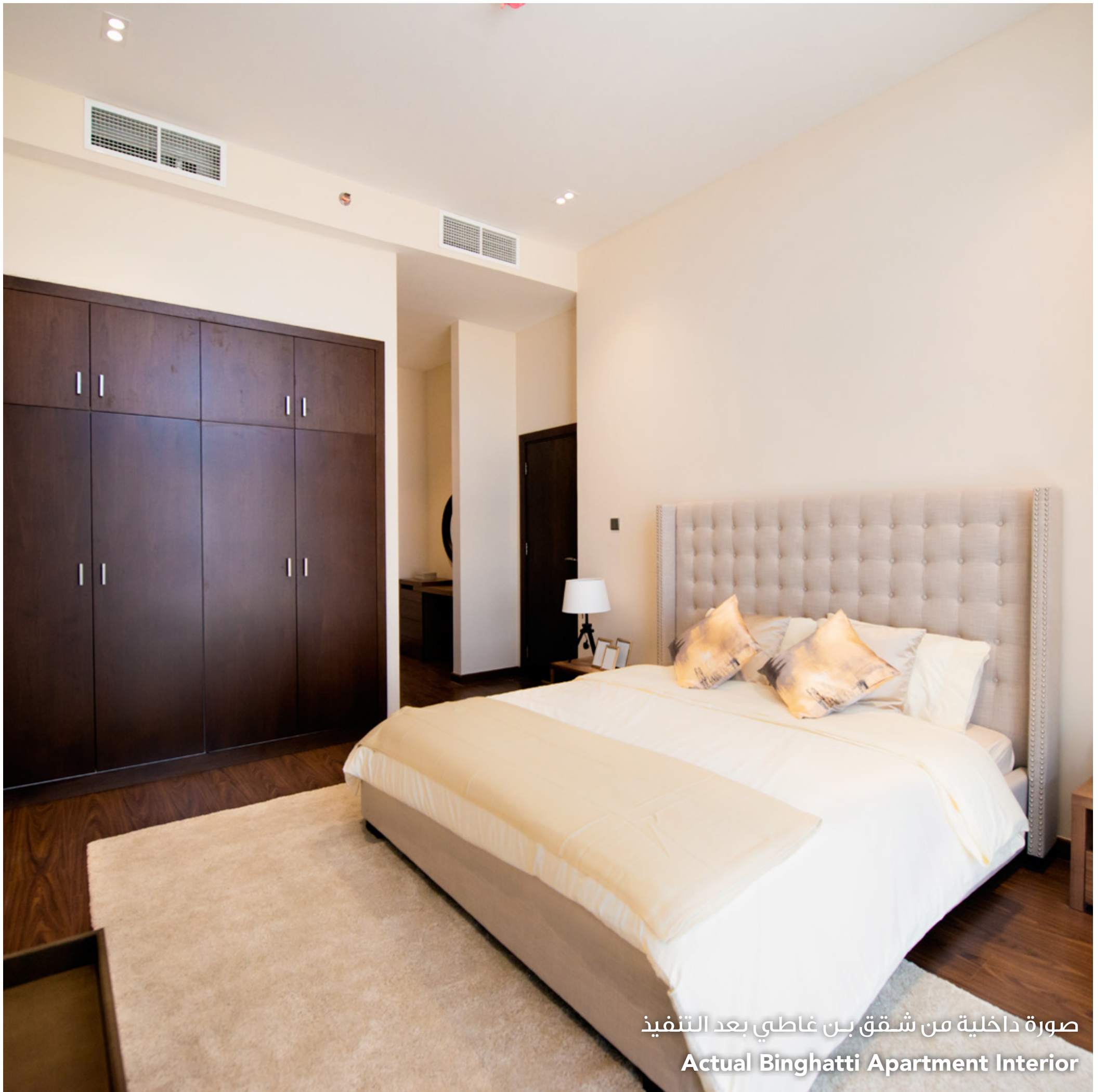
صورة داخلية من شقق بن غاطي بعد التنفيذ Actual Bingham Apartment Interior